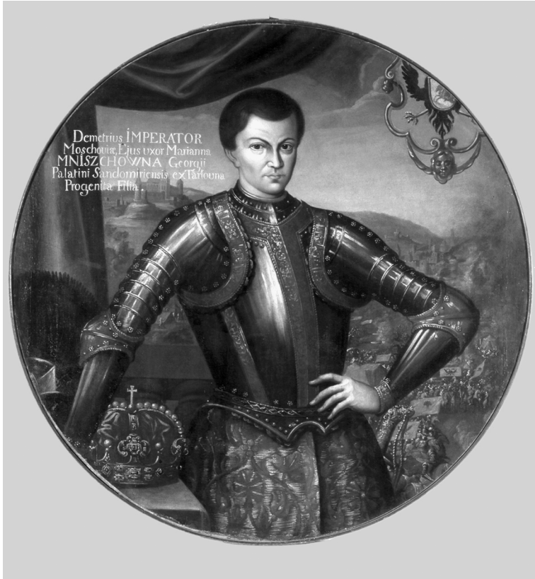
Ил. 14. Портрет Лжедмитрия I. Начало XVII в. ГИМ, Москва

лично принимает участие 109 . Все это свидетельствует о претензиях Самозванца и выглядеть внешне, и считаться “своим” среди европейских монархов. На намерение Лжедмитрия остаться таким и в традиции памяти о себе указывает охотничий штуцер 110 , изготовленный немецким мастером и украшенный изображениями диких животных. Охота с таким оружием была развлечением европейских королей и императоров, а не московских царей. На стволе штуцера сделана надпись: “Dometrius Imperator” 111 – еще одно свидетельство, наряду с монетами, печатями, медалями и доспехом, в котором отразились политические притязания Самозванца на европейскую идентичность московского царя.