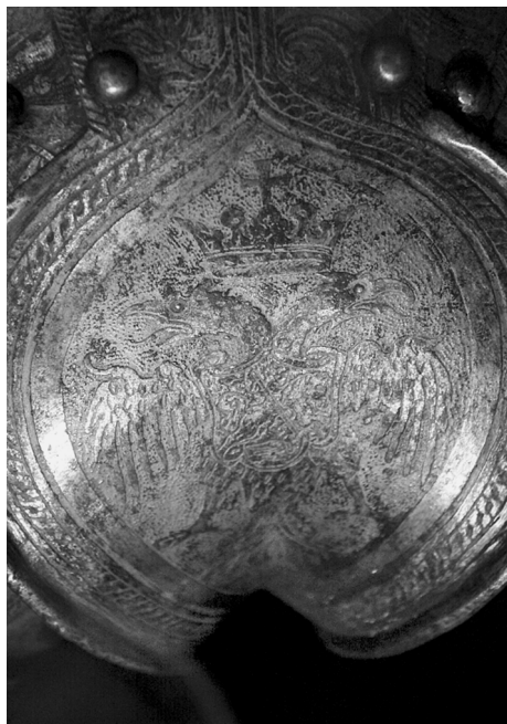
Ил. 7. Доспех Лжедмитрия. Фрагмент налокотника. ВИМАИВиВС, Санкт-Петербург. № 0137/369.