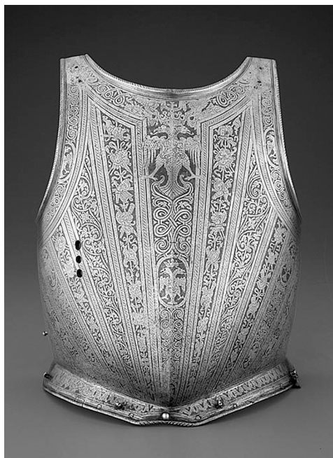
Ил. 10. Доспех Лжедмитрия. Нагрудник кирасы. Музей Искусства, Чикаго. № 1982.2430а-в.