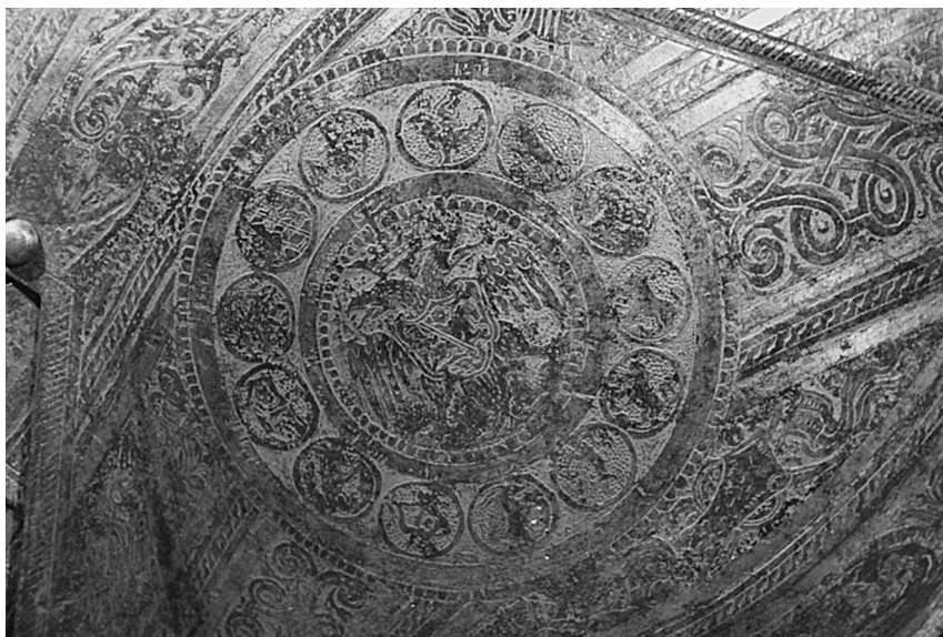
Ил. 9. Доспех Лжедмитрия. Фрагмент оплечья. ВИМАИВиВС, Санкт-Петербург. № 0137/369.