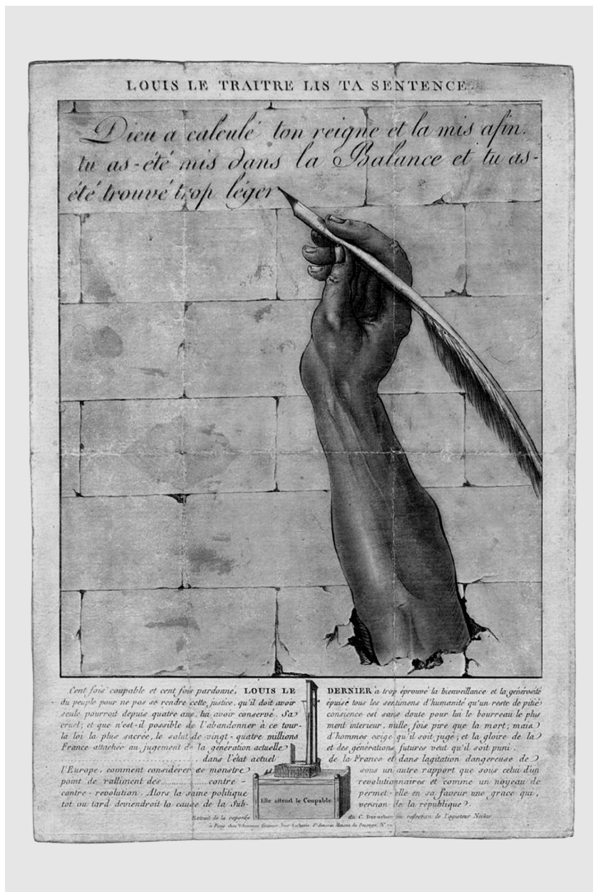
Ил. 2. Людовик-изменник, читай свой приговор. Эстамп 1793 г.