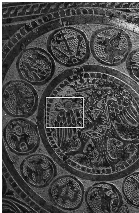
Ил. 13. Доспех Лжедмитрия. Фрагмент оплечья. ВИМАИВиВС, Санкт-Петербург. № 0137/369.

Изображение двуглавого орла, многократно воспроизведенное на доспехе (ил. 6, 7, 10–12), также специфично. Его крылья не сложены плотно и направлены вниз, как на оттисках и прорисовке печати, а несколько разведены в стороны. Кроме того, на крыльях изображены симметричные завитки (ил. 13) – элемент, присущий изображению орла не византийского 70 , а габсбургского типа. Схожая ситуация наблюдается и с изображением хвоста у орла: в отличие от оригинальной печати перья орлиного хвоста на доспехе широко расправлены в стороны. Расположенный на груди орла щиток с изображением всадника тоже имеет несколько иную форму, чем на оттисках и прорисовке. Нельзя сказать, что это изображение двуглава коренным образом отличается от