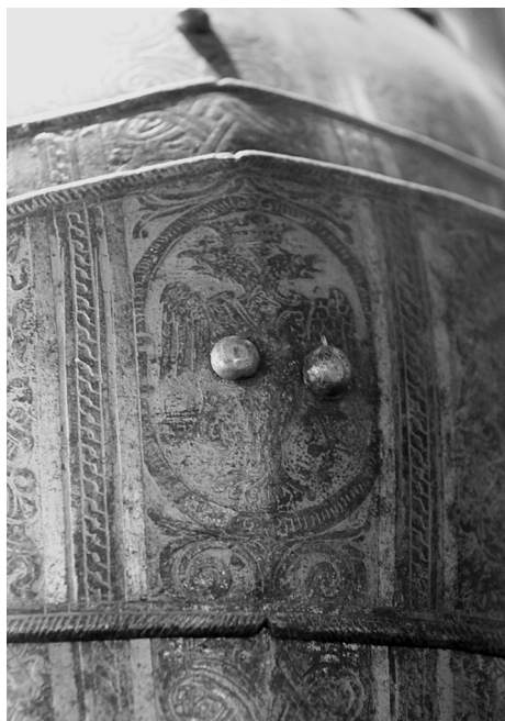
Ил. 6. Доспех Лжедмитрия. Фрагмент оплечья. ВИМАИВиВС, Санкт-Петербург. № 0137/369.