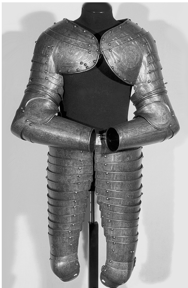
Ил. 5. Части доспеха Лжедмитрия. ВИМАИВиВС, Санкт-Петербург. № 0137/369.

печатью. Самозванец пренебрег этим принятым в канцелярии русских царей правилом, очевидно, потому, что брак с Мариной и родство с ее семьей представлялись ему событиями принципиальной важности. При этом у Лжедмитрия не было своей “большой” печати – он пользовался той, которая досталась ему от Ивана Грозного 48 . Тем не менее, его собственное видение “большой” государственной печати все же нашло отражение в