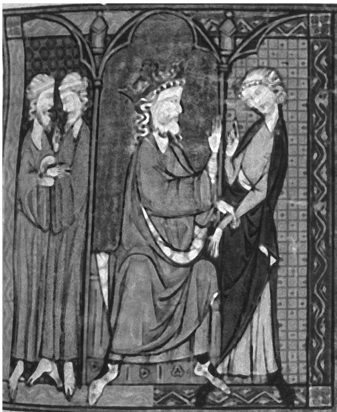
Король Марсилий заключает пакт с Ганелоном. Миниатюра. Большие Французские хроники

царем Гарнье, принимают сторону сарацинского короля Марсийона и вместе с ним сражаются против своих собратьев по вере 39 .