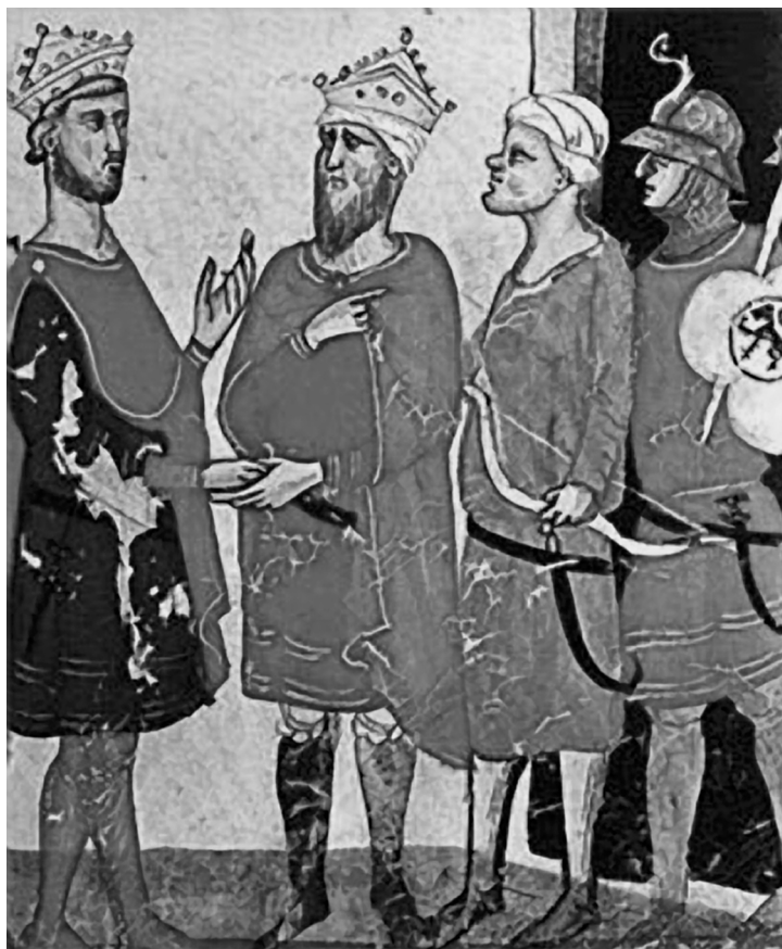
Встреча у стен Иерусалима императора Фридриха II и султана Египта Малика-аль-Камиля (“Новая хроника” Виллани)

Условия договора могли заставить некоторых усомниться в том, что с возвращением Святого Города восторжествовала христианская вера.