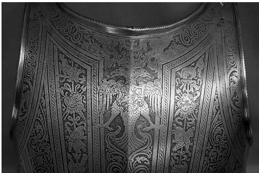
Ил. 12. Доспех Лжедмитрия. Фрагмент нагрудника кирасы. Музей Искусства, Чикаго. № 1982.2430a-b.