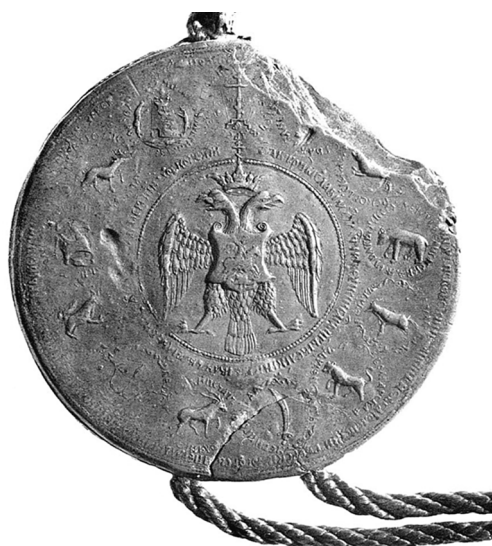
Ил. 3. Оттиск Большой государственной печати, 1578 г. Национальный Архив Дании (Rigsarkivet), Копенгаген