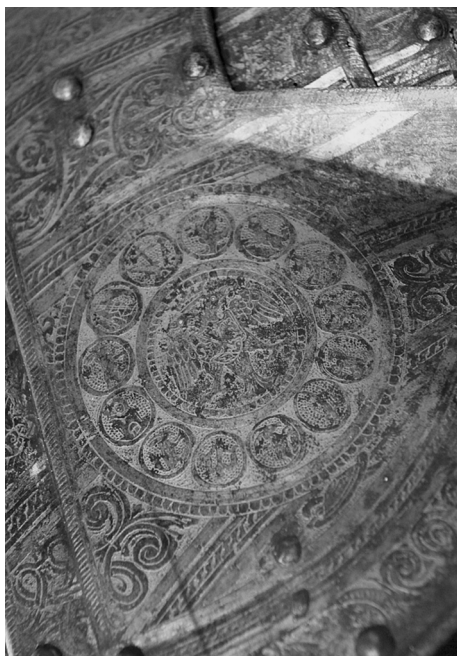
Ил. 8. Доспех Лжедмитрия. Фрагмент оплечья. ВИМАИВиВС, Санкт-Петербург. № 0137/369.