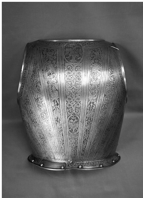
Ил. 11. Доспех Лжедмитрия. Наспинник кирасы. Музей Искусства, Чикаго. № 1982.2430а-в.