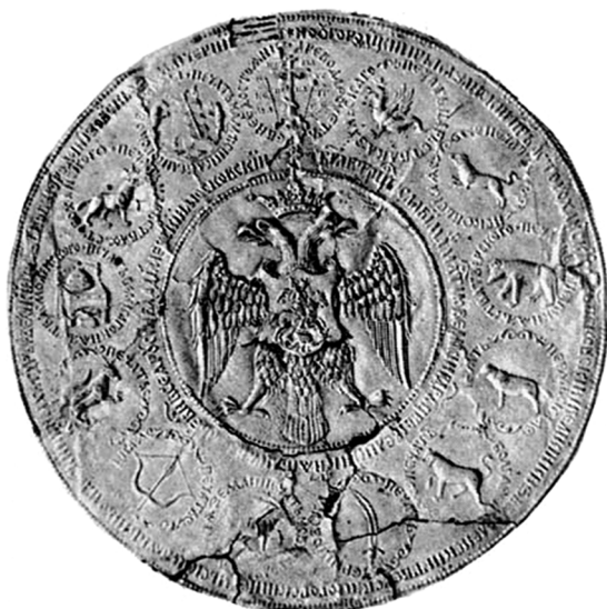
Ил. 4. Оттиск Большой государственной печати, 1583 г. Национальный Архив Швеции (Riksarkivet), Стокгольм.