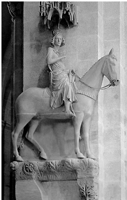
Илл. 10. Собор в Бамберге. Статуя всадника

Конечно, отсутствие более точной информации мешает утверждать что-либо с уверенностью; однако, учитывая сказанное выше, заинтересованное участие кого-то из бывших владельцев церкви