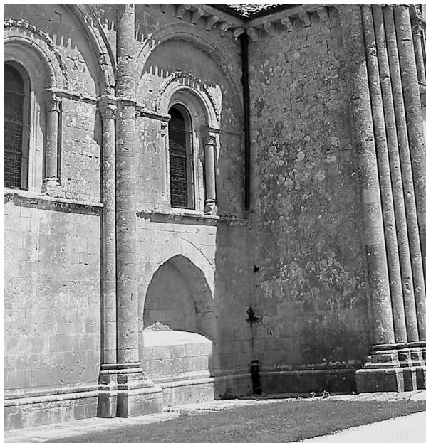
Илл. 6. Сен-Пьер в Ольне. Ниша в южной стене – предполагаемое погребение