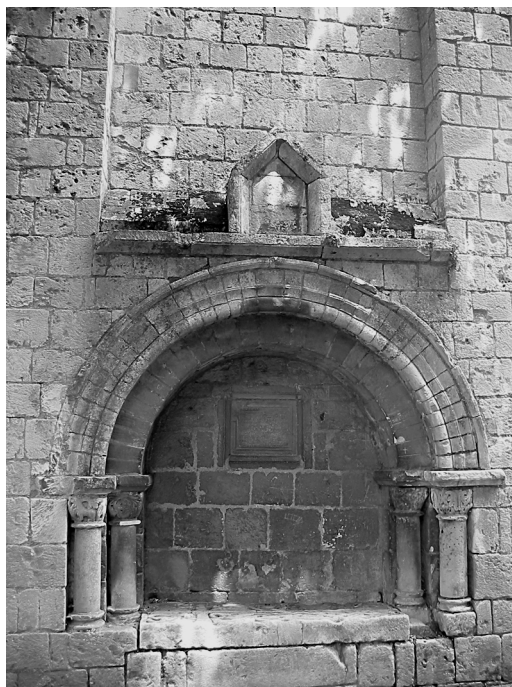
Илл. 7. Сент-Илер в Пуатзе. Погребение в южной стене церкви