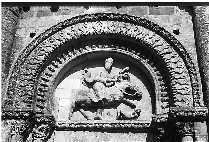
Илл. 2. Сен-Пьер в Партенэ-ле-Вьё, фасад. Левая арка верхнего яруса