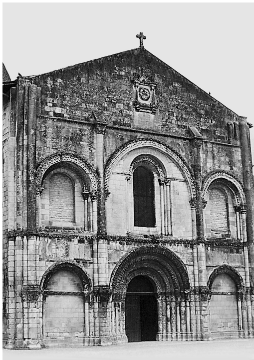
Илл. 1. Нотр-Дам в Сэнт