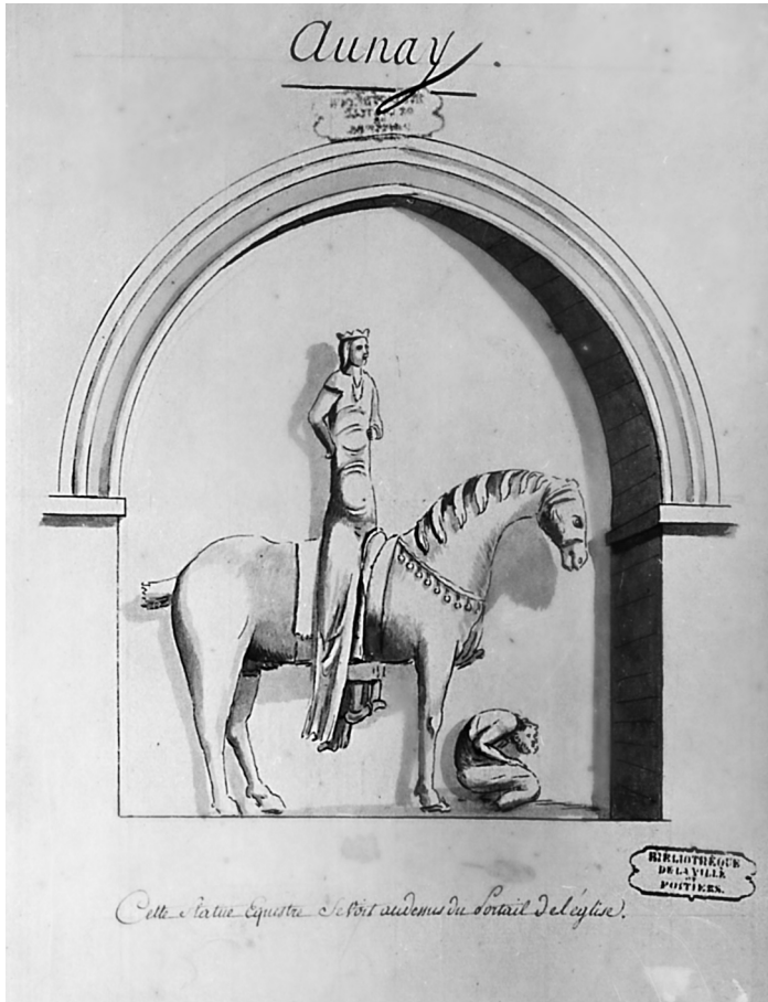
Илл. 8. Всадник в Ольнэ. Рисунок XVIII в.

местных сеньоров, а в одном из рассмотренных случаев изображение на печати повторяет характерные черты церковного рельефа 61 .