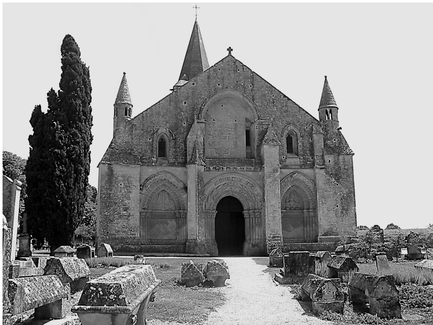
Илл. 3. Сен-Пьер в Ольне

(в одном случае это Сен-Жан д'Анжели, в другом – Сен-Киприан). В начале XII в. церковь оказывается целиком во владении монастыря Сен-Киприан; с 1122 г. она принадлежит соборному капитулу Пуатье.