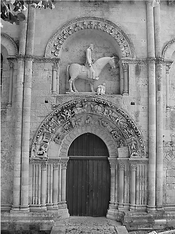
Илл. 9. Сент-Илер в Мелле. Северный фасад. Изображение всадника – реконструкция XIX в.

актуальным образом – именно так хронисты описывали герцогов Аквитании и их приближенных 69 . Святой Константин являлся образцом праведности для сильных мира сего (не исключено, что широкое распространение имени “Константин” в кругах аквитанской аристократии было связано с этим). С началом крестоносного движения образ Константина, попирающего язычество, должен был обрести новую актуальность, опять-таки в отношении светской аристократии: аквитанские рыцари активно участвовали в крестовых походах 70 . Отправился в поход и, по меньшей мере, один из виконтов Ольнэ – Каделон V, приняв участие в первой кампании 71 .