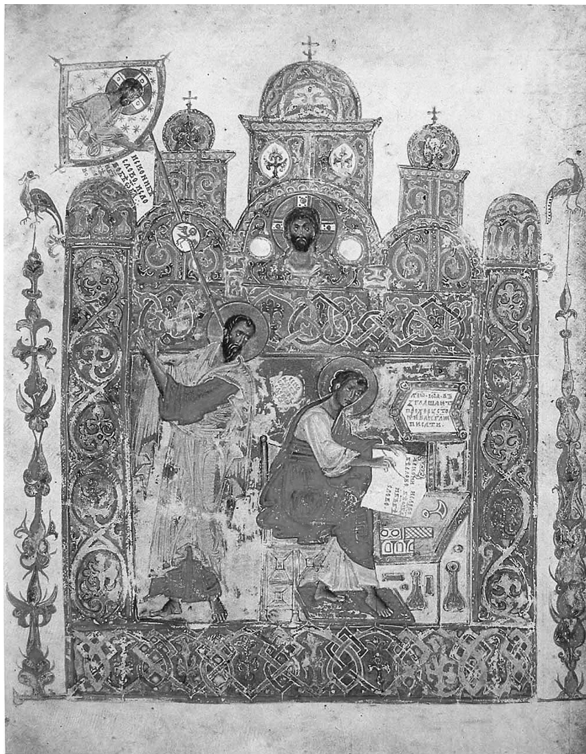
Миниатюра Федоровского Евангелия (1327 г). Евангелист Иоанн с учеником Прохором