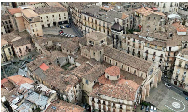
Илл. 1. Собор Свята-Мария-Ассунта, Козенца. Вид сверху.

Zimpel D. Die Bischöfe von Konstanz im 13. Jahrhundert (1206–1274). Frankfurt-am-Main, 1990.