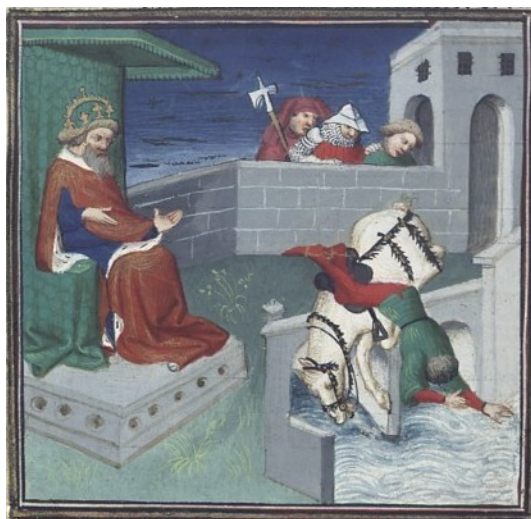
Илл. 4. Генрих падает с лошади на мосту.

Из иллюминированной рукописи книги Джованни Боккаччо О несчастиях знаменитых людей , переведённой на среднефранцузский язык. Jehan Boccace. Des Cas des Nobles Hommes et Femmes / trad. L. de Premierfait: [Иллюминированная рукопись] . Нач. XV в. BNF. Français 226. Anc. 6878. Fol. 260v.