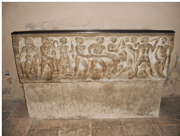
Илл. 3. Мраморный позднеантичный саркофаг Генриха (VII) со сценой Калидонской охоты.